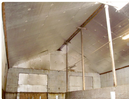
Staðsteyptri hlöðu breytt í fjós, klætt neðan á bönd með 50 mm plötum m/áli.