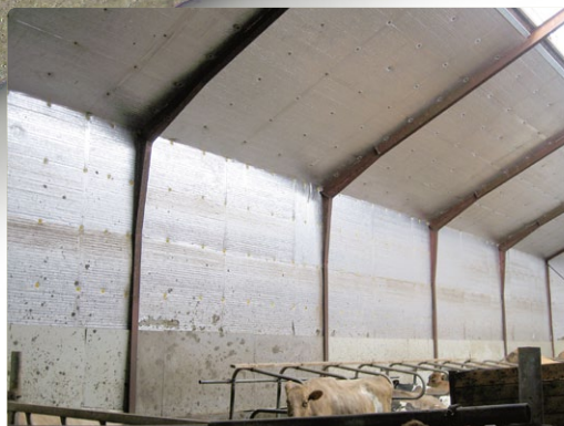
Stálgrindaskemmu breytt í fjós, klætt með 50 mm plötum í þak og 30 mm plötum á vegg.

Notkun þessara platna er ekki endilega bundin við gripahús eða hlöður því þær henta að sjálfsögðu vel ýmiskonar iðnaðar- og geymsluhúsnæði.